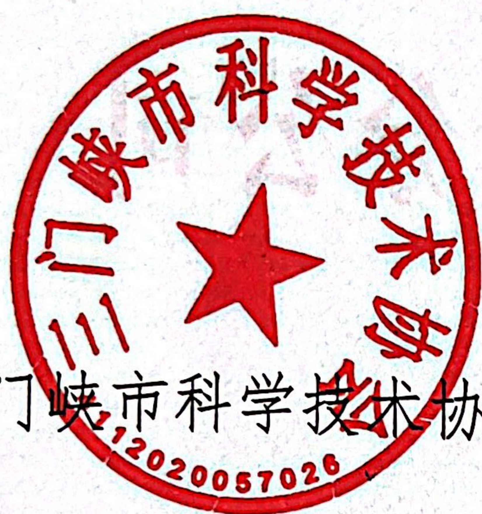
三门峡市科学技术协会

素质，根据中国科协《“银龄跨越数字鸿沟”科普专项行动方案（2022-2025 年）》，制定《三门峡市“银龄跨越数字鸿沟”科普专项行动实施方案（2023-2025 年）》，现将方案印发给你们，请结合本地区、本单位实际，认真贯彻落实。