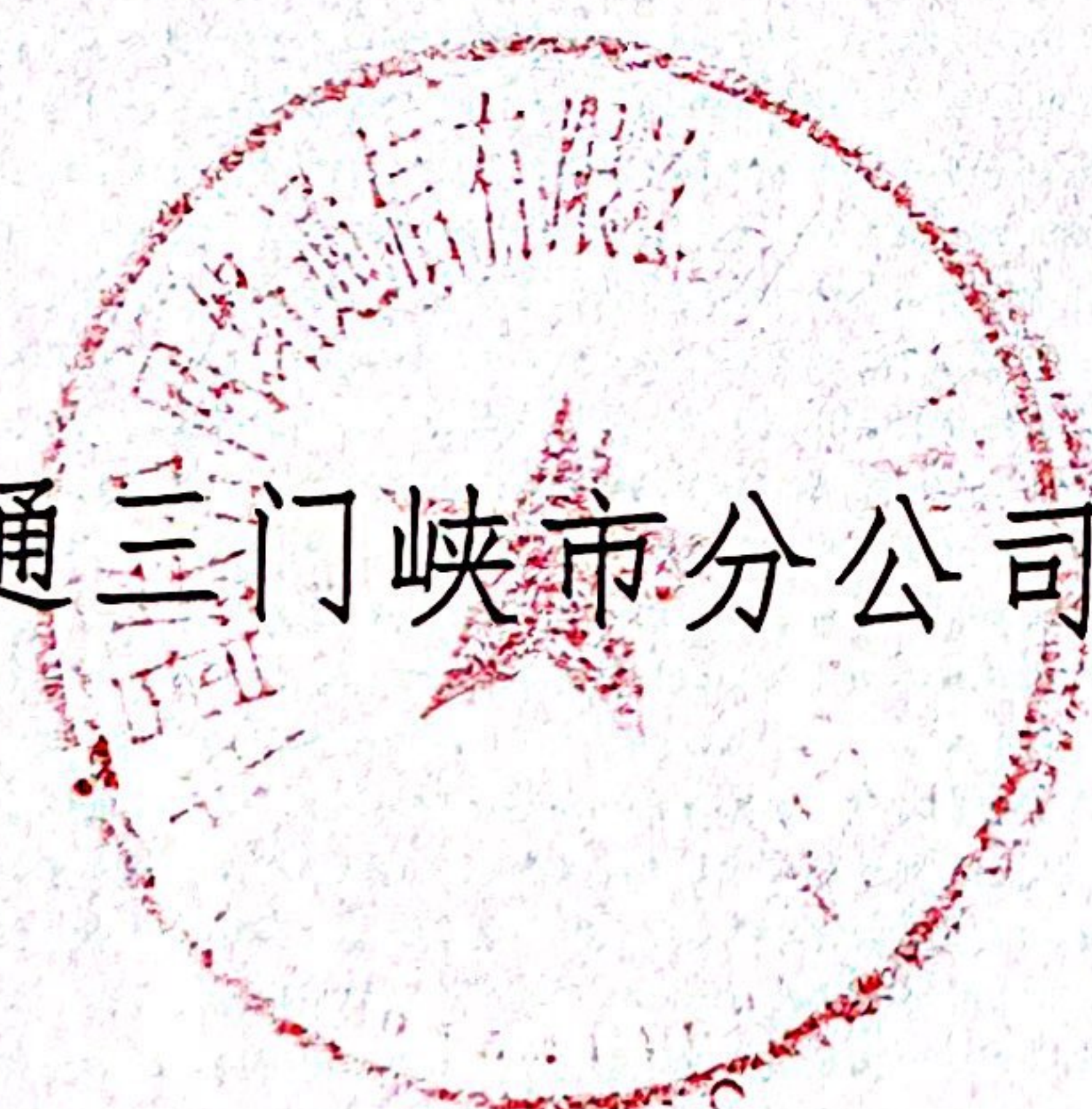
中国联通三门峡市分公司